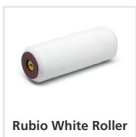
Rubio White Roller